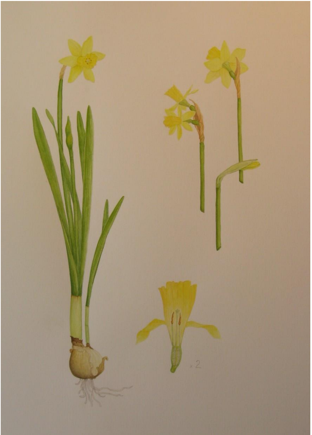
Jag lade till två små blyertsdetaljer till höger om den halva blomman sen också.