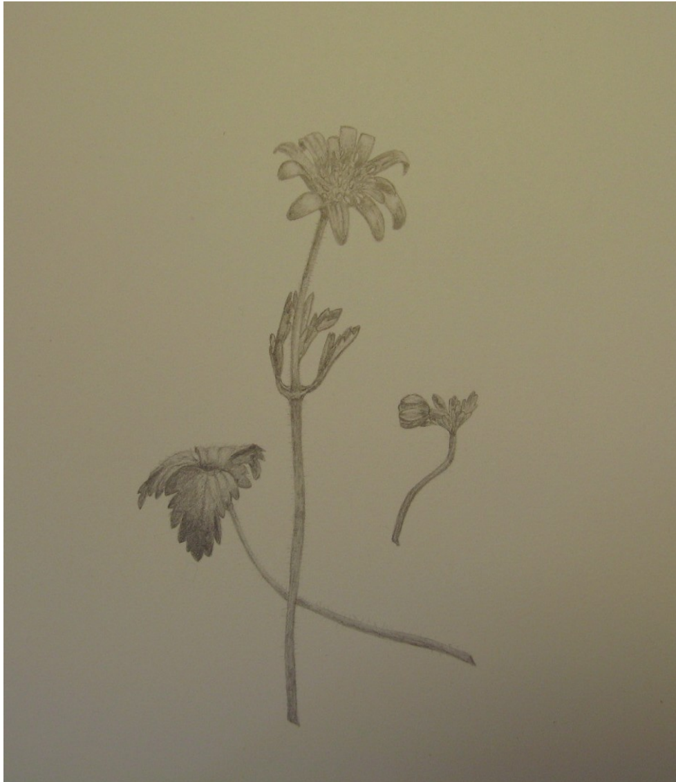
'Anemone blanda' - Balkansippa